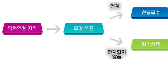
[그림 4] 자격 학습구분 결정 기준