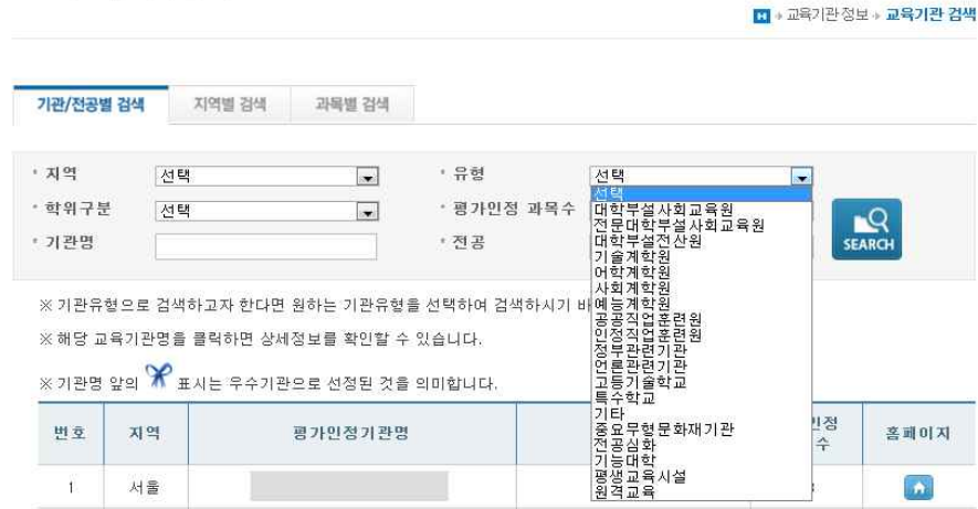
[그림 3] 교육훈련기관 검색 메뉴

(1) 기관/전공별 검색 : 대학부설평생교육원, 전산원, 원격교육기관 등 기관유형에 따른 교육훈련기관 검색 및 전공에 따른 교육훈련기관 검색