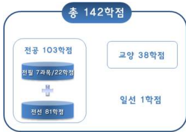
[그림 10] '예시 2'의 총학점 구성도