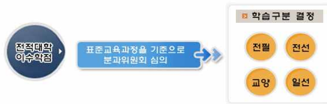
[그림 8] 학점인정대상학교 학습구분 결정 기준