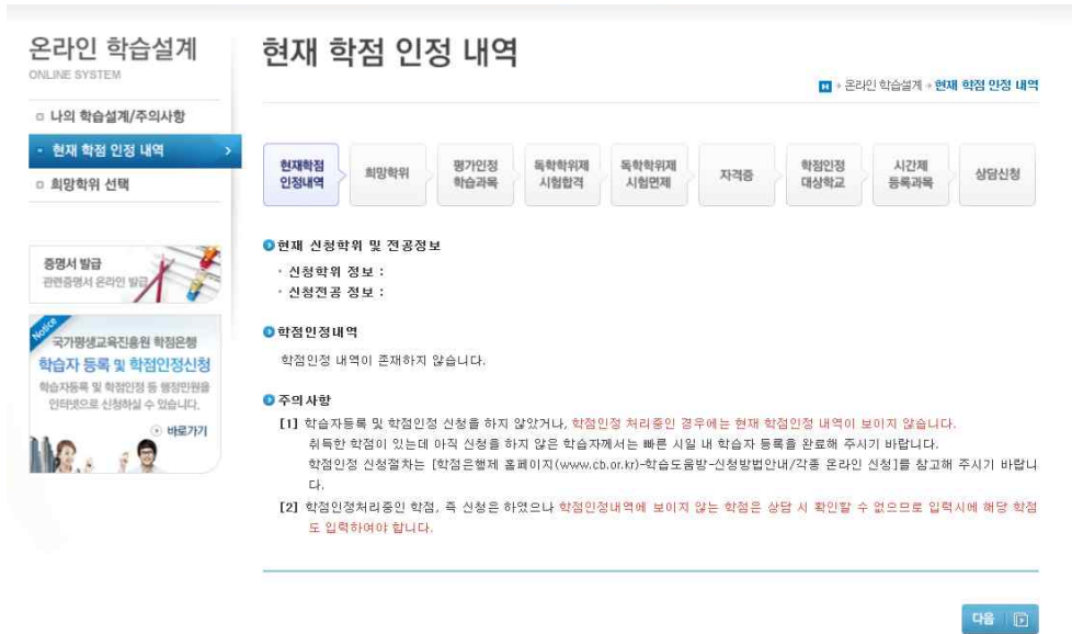
[그림 11] 온라인 학습설계 상담 메뉴