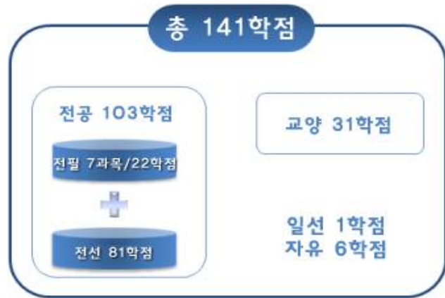
[그림 9] '예시 1'의 총학점 구성도